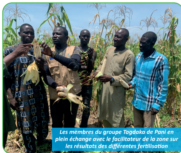
Les membres du groupe Tagdaka de Pani en plein échange avec le facilitateur de la zone sur les résultats des différentes fertilisations

Un total de 09 Champs Ecole Paysan (CEP) a été mis sur pied dans neuf (09) Communautés riveraines au PNB, notamment dans les localités de Banda (ZIC 1 1), Dogba (ZIC 4), Na'ari, Agorma (ZIC 7) Ouro André (ZIC 8), Larki, Pani, Wafango et Mboukma (ZIC 9). Ces CEP regroupent 20 à 25 agriculteurs et agricultrices intéressés et disponibles. Ces derniers-ci, sont outillé(e)s aux techniques de d'amendement naturelle