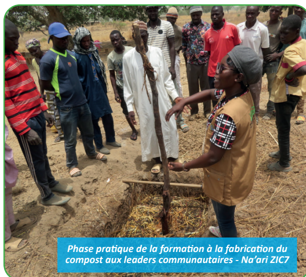
Phase pratique de la formation à la fabrication du compost aux leaders communautaires - Na'ari ZIC7

« Nous avons testé ces techniques dans les CEP avec les bénéficiaires pour voir quels sont leurs effets. A l'issue des tests, la latitude était donnée à chaque agriculteur/agricultrice de choisir parmi toutes les techniques testées celle(s)