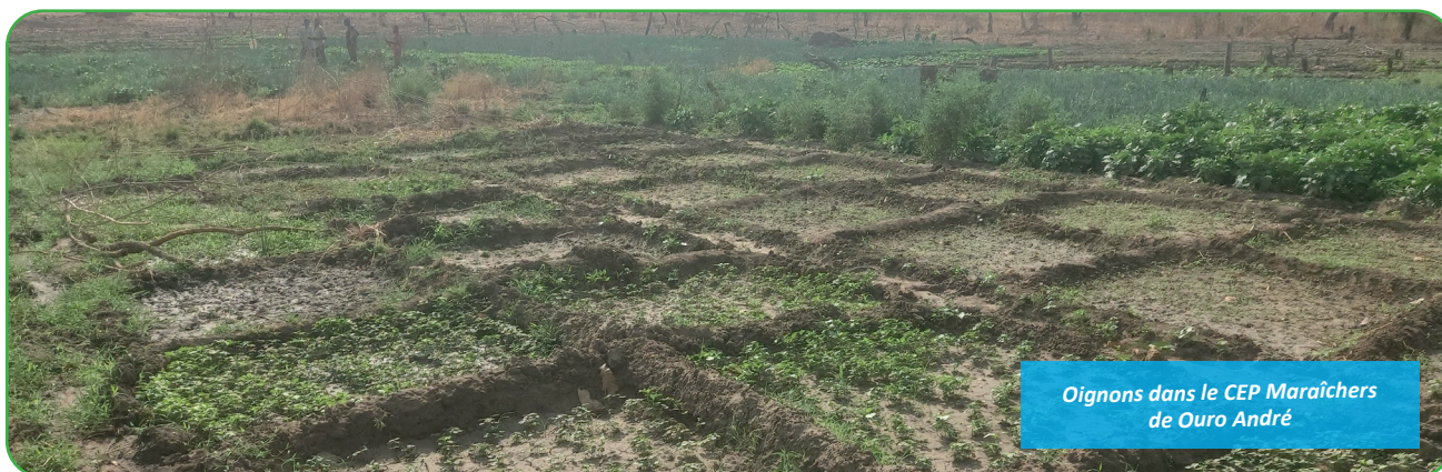
Oignons dans le CEP Maraîchers de Ouro André

Les activités des CEP sont implémentées sur des superficies allant de 0,25 à 0,5 hectares. Leur réplification par les agriculteurs et agricultrices dans leurs champs personnels (collectifs et individuels), permet qu'environ 300 hectares de terres soient en cours de restauration. Les rendements sur les parcelles restaurées ont été