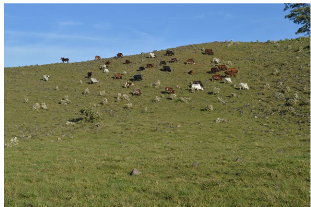
Troupeau de bœufs observé dans une savane herbeuse d'altitude du massif de Tchabal Mbabo.

Les forêts tropicales de montagnes parmi lesquelles le massif forestier de Tchabal Mbabo sont reconnues comme des hotspots (lieu public à forte affluence) de la biodiversité et des refuges pour de nombreuses espèces endémiques et menacées. Celles-ci fournissent des services écosystémiques importants tels que la régulation de la qualité de l'air, la séquestration du carbone, la régulation du bilan hydrique et protègent contre l'érosion. Le massif de Tchabal Mbabo représente un vaste écosystème forestier avec une superficie d'environ 105.251 hectares et une biodiversité exceptionnelle. Ce massif héberge une faune riche et très diversifiée de mammifères, oiseaux, reptiles, amphibiens et insectes. Cette faune fait face à plusieurs menaces entre autres les activités humaines et les changements climatiques. Face à ces menaces, le Ca-