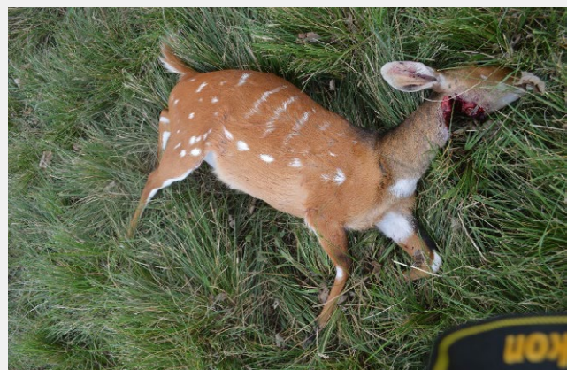
Guib harnaché (femelle) abatu par un chasseur local

Parmi les principales familles des espèces concer-