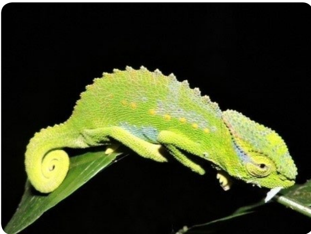
Trioceros Wiedersheimi Wiedersheimi (mâle)