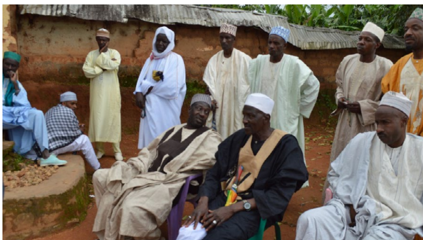
Population du village Mayo kélélé rassemblée pour les activités du projet COGESPA

50 affiches en grand format (A0) en français et ffuldè (langue locale) expliquant les mécanismes de plaintes ont été affichées dans les chefferies traditionnelles les lieux publics de la zone du projet. Ces affiches étaient accompagnées de 12 registres remis aux Djaouro (chefs traditionnels) présents. Ces registres, servent à l'enregistrement des plaintes et doléances des populations lors de la mise en œuvre du projet. Avec ces affiches présentant les mécanismes de plaintes, les populations s'approprient des outils de gestion transpa-