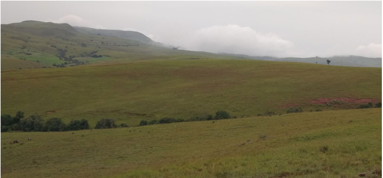
Espace pour faire paître les bêtes

aires protégées, le rythme de perte de la diversité biologique ne diminue pas. Alors, identifier les activités des hommes qui influencent sur certains groupes d'intérêts pour la conservation, est indispensable. Elle permettra de mettre sur pieds des stratégies de protection de ces ressources. Une mission préliminaire prospective dans plusieurs forêts (Pinko, Garouwal et Danoua) a été menée par une équipe de FODER.