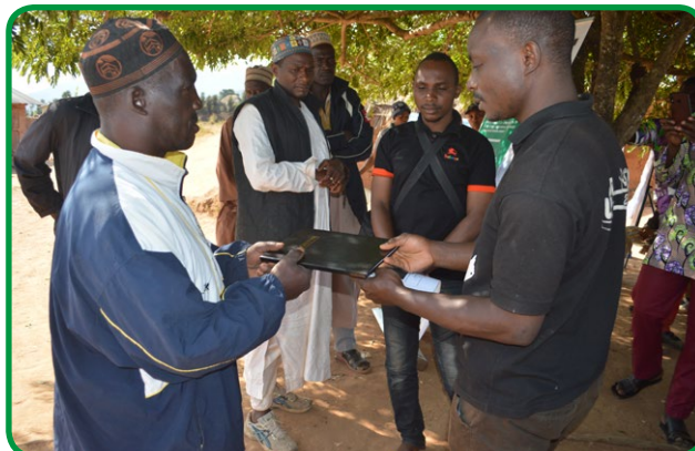
CLIP des membres du village Mayo Lelewal

Dans l'optique d'obtenir le Consentement Libre Informé et Préalable (CLIP) des communautés riveraines du massif forestier de Tchabal Mbabo pour la bonne mise en place du projet COGESPA, des actions de sensibilisation ont été menées. A l'issue de ces actions, le projet a obtenu le CLIP dans 28 villages du massif, dont Dodeo, Mayo Lelewal, Fougoi et Lompta pour ne citer que ceux-ci. Au moins 2225 personnes ont été sensibilisées sur le potentiel et les menaces qui pèsent sur la biodiversité du massif forestier de Tchabal Mbabo dans 28 villages des arrondissements de Banyo, Kontcha et Galim Tignère. Soit 39,64% de femmes et près de 25% de personnes issues de la minorité Bororo. Les populations ont été sensibilisées sur le potentiel faunique et les services écosystémiques que procurent le massif forestier, également, les menaces liées à la mauvaise gestion du massif forestier et les impacts négatifs que cela peut engendrer sur leur vie et celles des générations futures. Les chefs de village ont exprimé leur crainte de voir le projet COGESPA-Tchabal Mbabo contribuer à leur expulsion du massif, s'il venait à être classé comme Aire Protégée. L'équipe du projet, les a rassurés sur