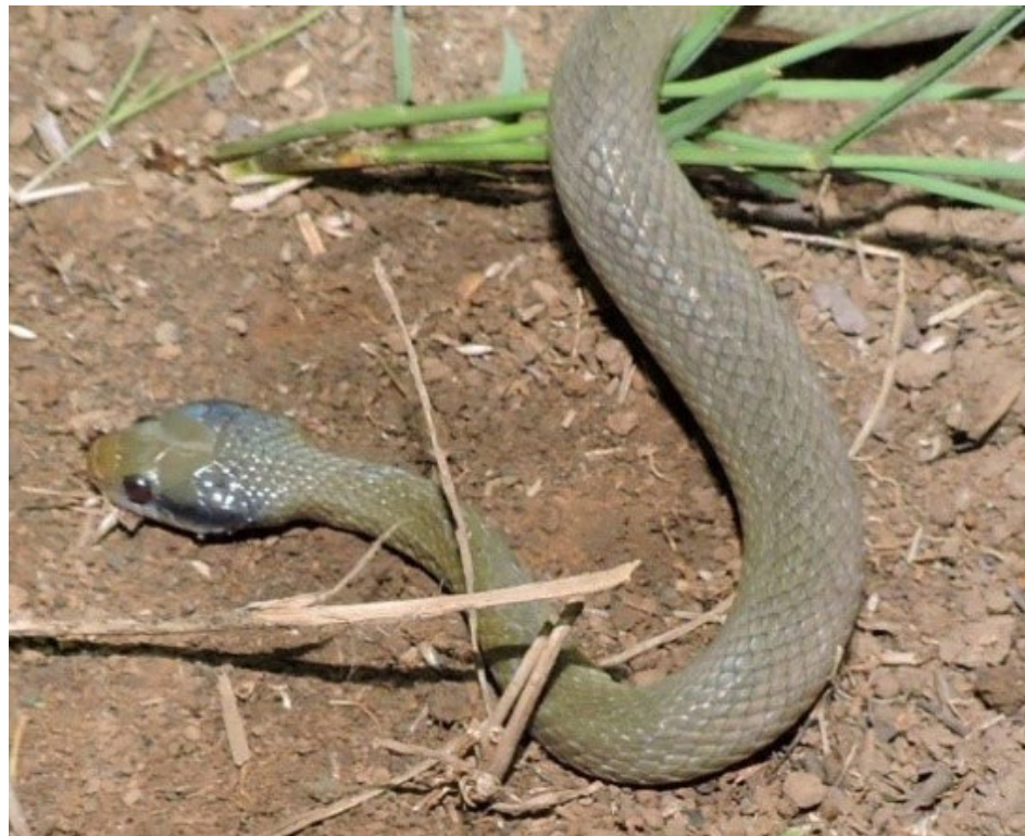
Crotaphopeltis cf hotamboeia

labris , Crotaphopeltis cf hotamboeia : Philothamnus sp et Crocodylus niloticus qui n'étaient pas connu du site (Herrmann et al., 2006; Chirio & Lebreton, 2007). La partie Est du secteur de Pinko compte plus de 10 indices au kilomètre ; cela serait dû à la présence de la forêt d'altitude de Pinko.