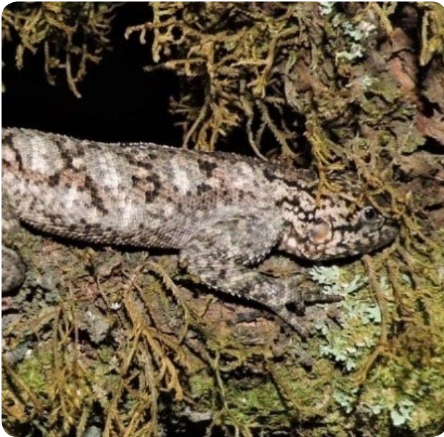
Agama Doriae Benueensis (mâle)