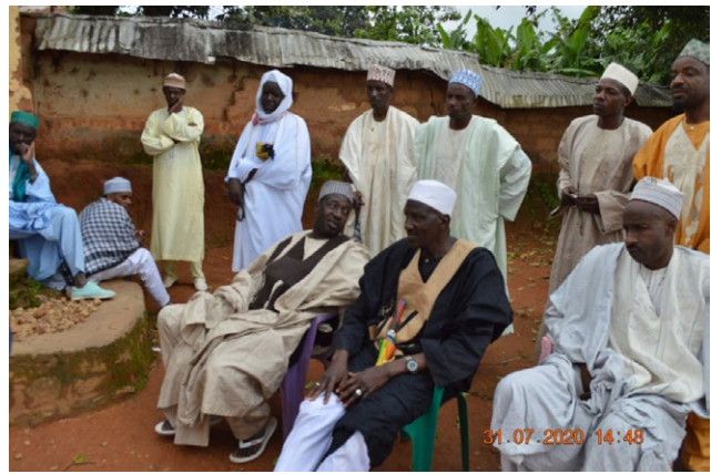
Réunion de sensibilisation de la population locale à Mayo Kélélé

Dans l'optique de protéger les ressources présentes à l'intérieur du massif, FODER à travers le projet d'appui à la conservation et à une gestion durable et participative (COGESPA) sensibilise d'avantage la population riveraine à une meilleure gestion de leurs ressources naturelles par la création des comités locaux de gestion des ressources naturelles. Pour les sensibilisations, il a été produit des outils de communication et de sensibilisation. Notamment, la boîte à images, l'affiche sur « Le mécanisme des plaintes et des doléances » (en Français et Arabe), la News-let-ter, des spots publicitaires sur les Comités Locaux de Gestion des ressources naturelles (CLG) ( en langue locale : fufuldé ), le Briefing News (CLIP-COGESPA) et plusieurs articles.