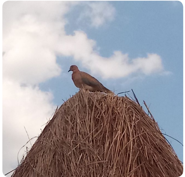
La Tourterelle maillée 2