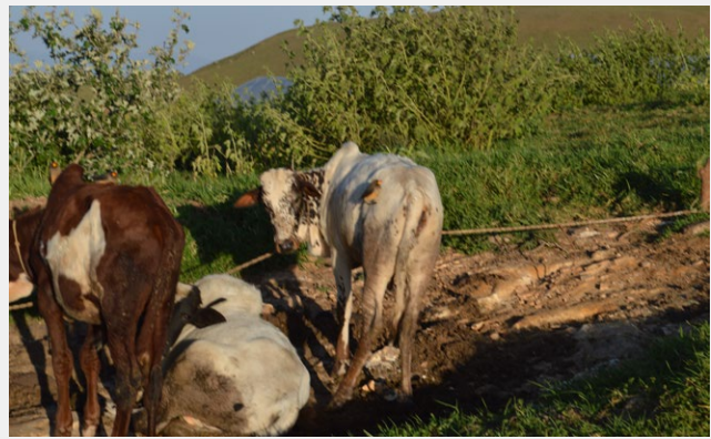
(Bœufs) en plein pâturage

Les CLGRN veillent aux respects des règles définies pour l'exploitation durable des ressources