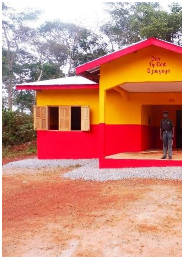
Légende: Centre de santé de la communauté de Djouyaya obtenu un plaidoyer communautaire. FODER 2019

Au rang des actions de plaidoyer communautaire menées pour solutionner le problème d'étroitesse des zones agroforestières, figurent deux réunions multipartites sur ce sujet ont été organisées réalisées à Mindourou (juillet 2017) et Abong Mbang (Juillet 2019). A l'issue de la deuxième réunion multipartite, la société attributaire de l'UFA 10037 a engagé la mise en œuvre des recommandations. Cette entreprise a organisé elle-même, une réunion à Zoulabot 2 en date du 12 Août 2019 pour le recul des limites de leur UFA au niveau des villages Massen et Zoulabot. L'entreprise a également permis à l'issue de discussions que l'on qualifierait de pacifiques, que la communauté d'Eschiambor empreinte les pistes créées pour l'exploitation afin de pouvoir accéder et évacuer le bois issu de la parcelle annuelle de la Forêt communautaire ZIENGUA MILEME. Cette dernière étant située à proximité de son UFA. Elle a aussi entrepris la rectification du layon de d'élimination séparant L'UFA 10037 de cette FC.