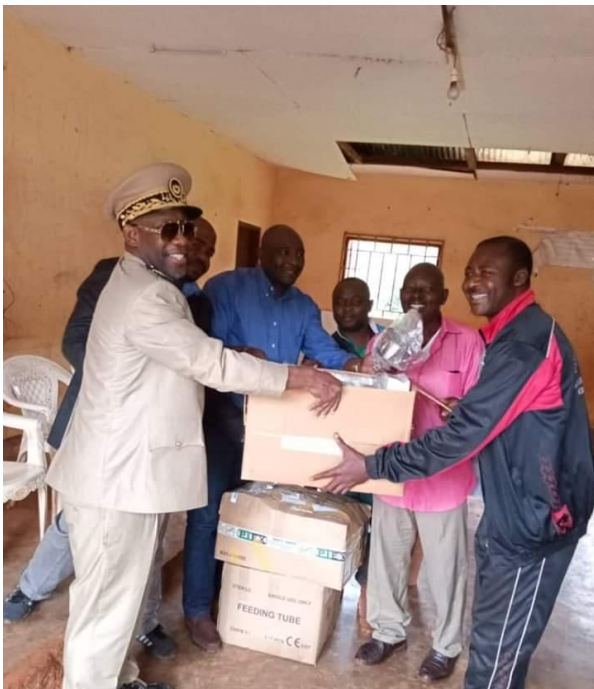
Remise du materiel medical pour le Centre de santé de Djouyaya. FODER 2019