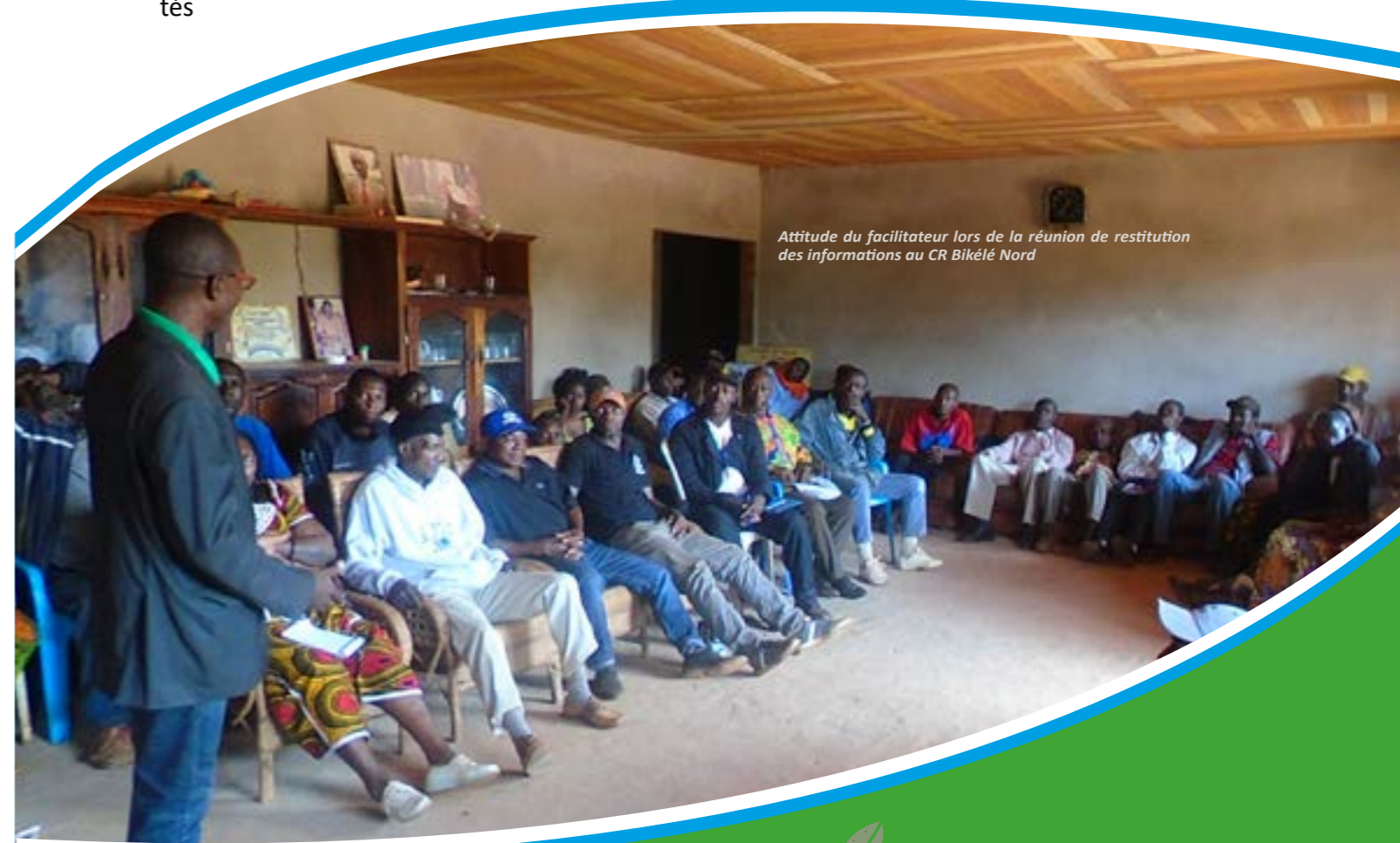
Attitude du facilitateur lors de la réunion de restitution des informations au CR Bikélé Nord

Les photos ci-dessous présentent quelques rencontres avec les acteurs locaux réalisées dans le cadre du suivi de la gestion par la commune de Messamena des revenus destinés aux communautés